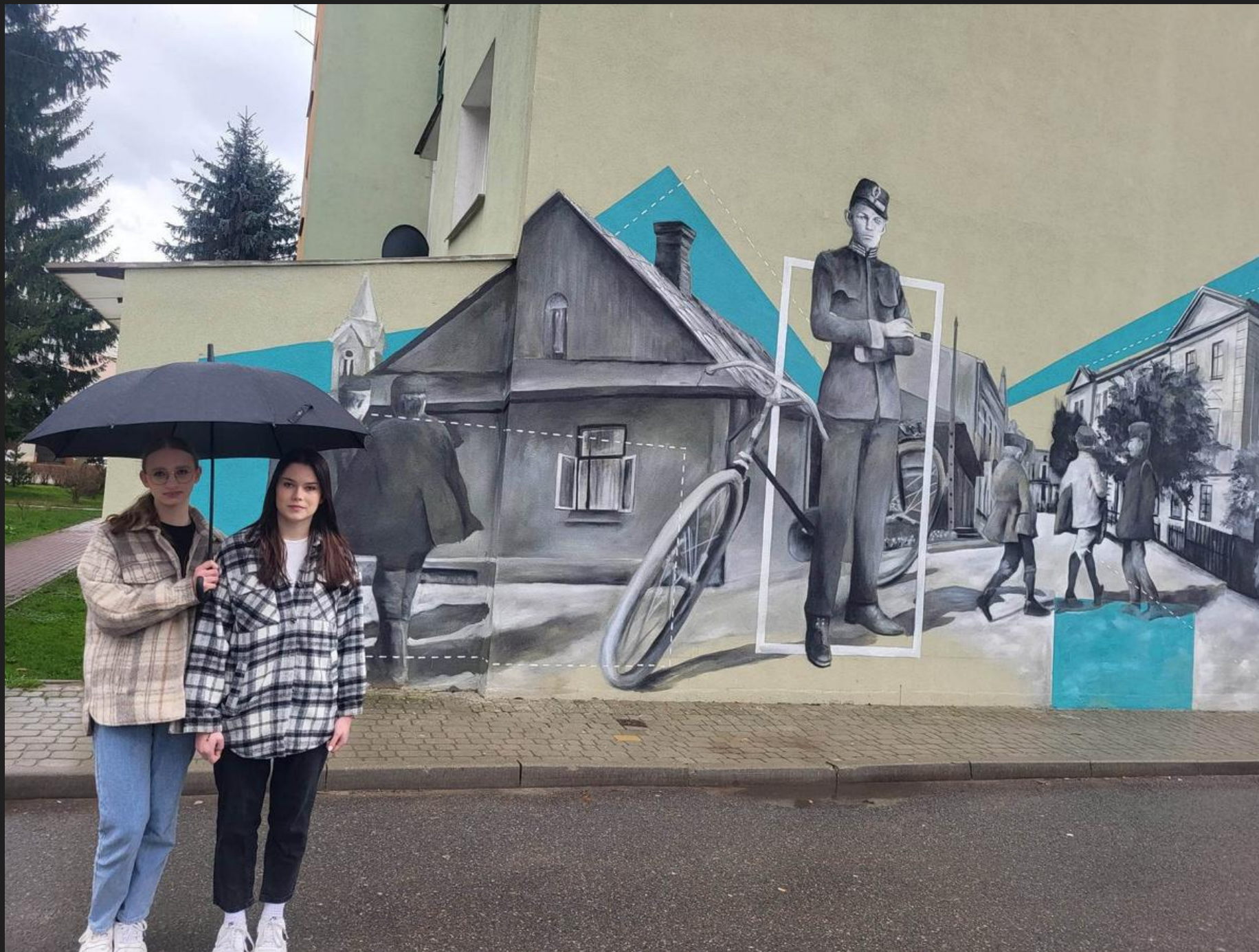
Mural autorstwa Arkadiusza Andrejkowa...