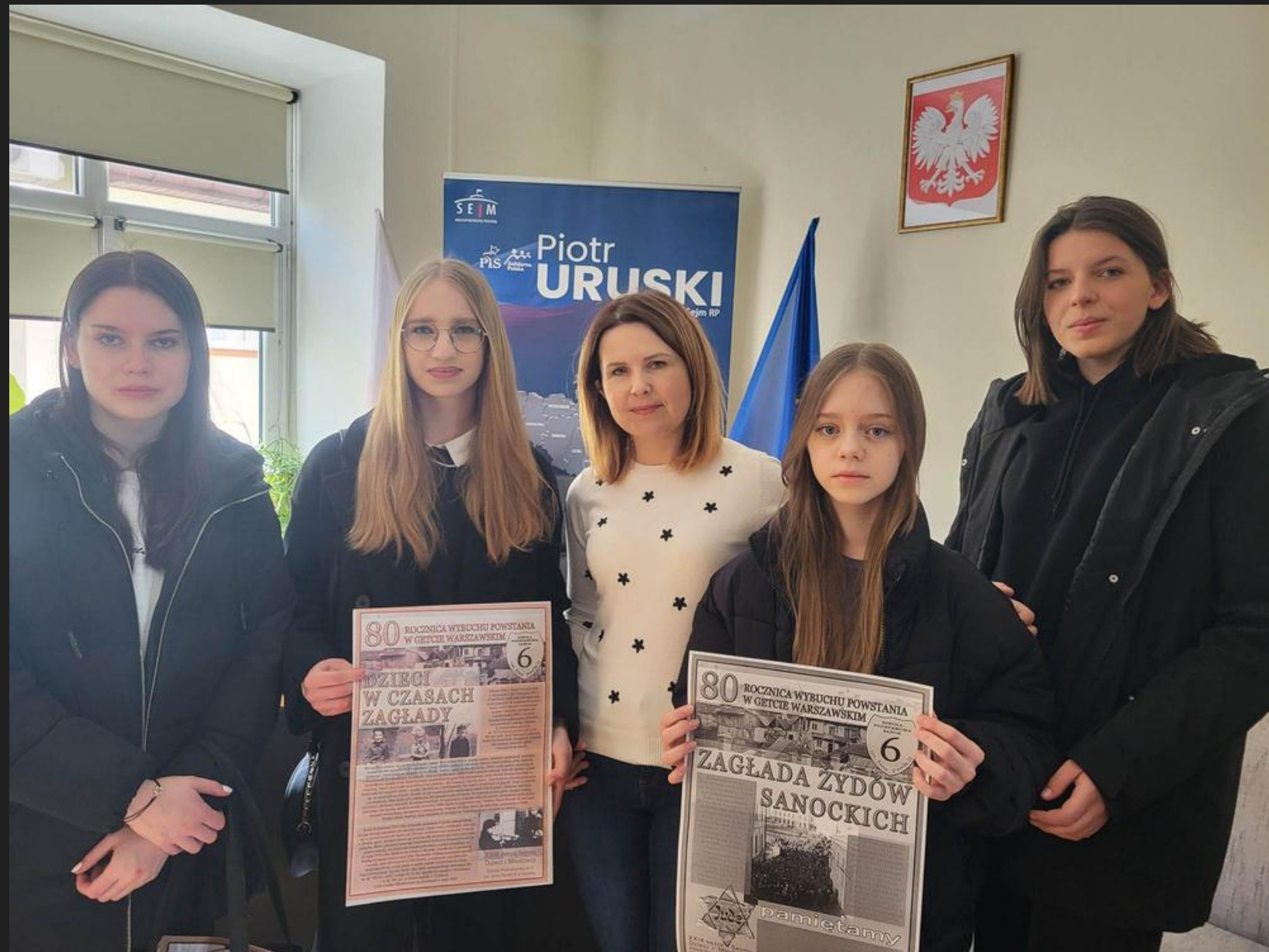
Spotkanie z Panem Posłem Piotrem Uruskim.